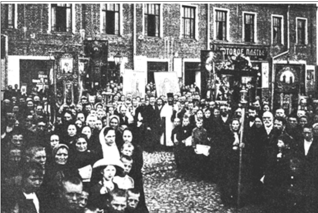
Выход крестного хода московского Варнавинского народного общества трезвости для встречи Почаевской иконы Божией Матери. 1913 г.

раемы кандидаты для занятия мест в клире, должна происходить оценка поведения и деятельности этих лиц и т.п.; и во всяком случае состояние опьянения, заметного на посторонний взгляд, должно для духовного лица считаться совершенно недопустимым ни при каких обстоятельствах. И начать такое восстановление истинно-церковных понятий об употреблении алкогольных напитков, не дожидаясь каких-либо особых церковных узаконений на этот счет, может каждый священник в своем приходе, каждый даже мирской ревнитель православия и церковности в своем кругу, – стоит только взять за исходный пункт данные церковного устава по данному предмету, основательно уяснить их со стороны принципиальной и затем развить эти принципы в связи с современным положением вопроса во всестороннем его освещении.