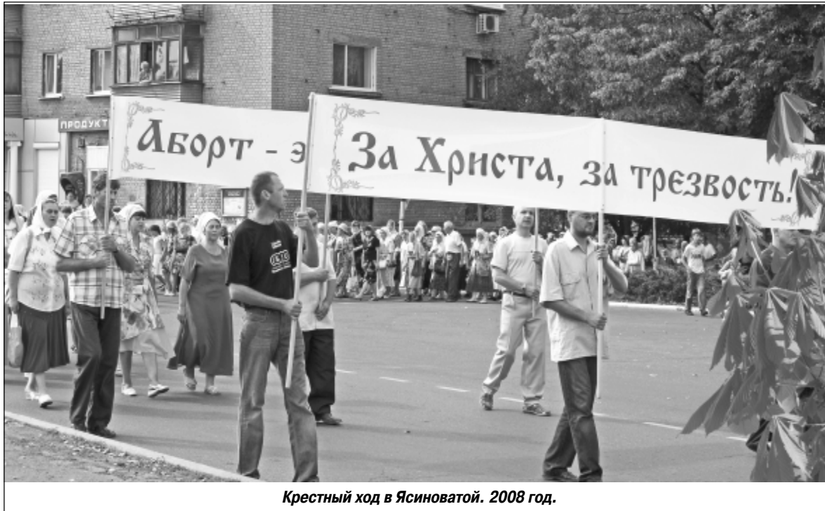
Крестный ход в Ясиноватой. 2008 год.

Донбасское православное общество «Трезвение»