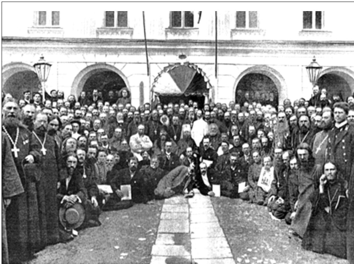
Участники Всероссийского съезда практических деятелей по борьбе с алкоголизмом. Москва, 6-12 августа 1912 г. В 3-м ряду в центре в белой клобуке митрополит Владимир.

Таким образом, «на Съезде выяснилось два факта: с одной стороны, необходимость самого тесного объединения деяте-