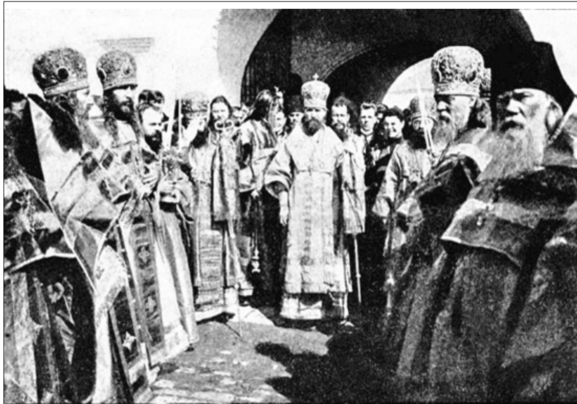
Митрополит Владимир (Богоявленский) в Лукецком монастыре, 1908 г.

Теперь весьма поучительно проследить, как выполнялся и выполняется в действительности людьми церковно-верующими церковный устав со стороны своих норм относительно вина; и чтобы рельефнее определить характер практического отношения к этим нормам – весьма важно в данном случае провести параллель с выполнением устава со стороны его требований относительно пищи. Если в настоящее время и не приходится уже говорить о вполне строгом соблюдении постов даже среди простого православного народа, то все-таки, прежде всего, сведения относительно требований устава на этот счет у всех православных людей имеются более или менее полные и ясные, иногда даже очень подробные; а с другой стороны – и выполняются посты в массе православного народа (не в простонародьи только) довольно близко к требованиям устава (не говоря уже о духовенстве, особенно – монашествующем); а если кем посты и не соблюдаются со всей точностью, то все-таки о них помнят, все-таки до некоторой степени угрызаются совестью за их несоблюдение, каются в этом несоблюдении, как в грехе несомненном; что же касается