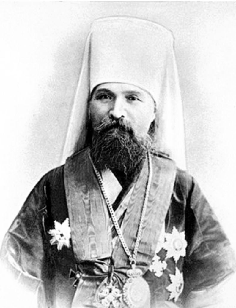
Владимир (Богоявленский), фото 1910 года

Первая часть этого произведения наполнена невыразимой скорбью о тех, кто не понимает всего ужаса этого греха и не желает расстаться с пагубной страстью... Он констатирует, что трезвенники на каждом шагу встречаются с большими трудностями и приходит к выводу: «Ничего нет неразумнее, как выступать со своими силами против силы, которая сильнее нас».